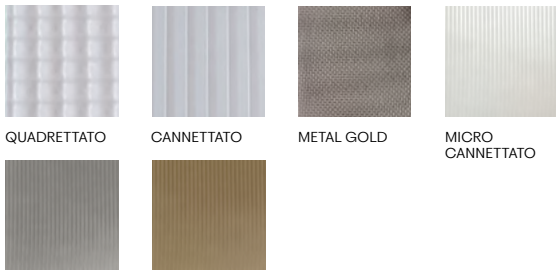
QUADRETTATO CANNETTATO METAL GOLD MICRO CANNETTATO MICRO CANNETTATO FUMÉ MICRO CANNETTATO BRONZO